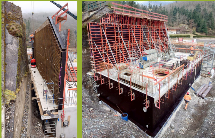
Avancement des travaux de la station de traitement des eaux au tunnel